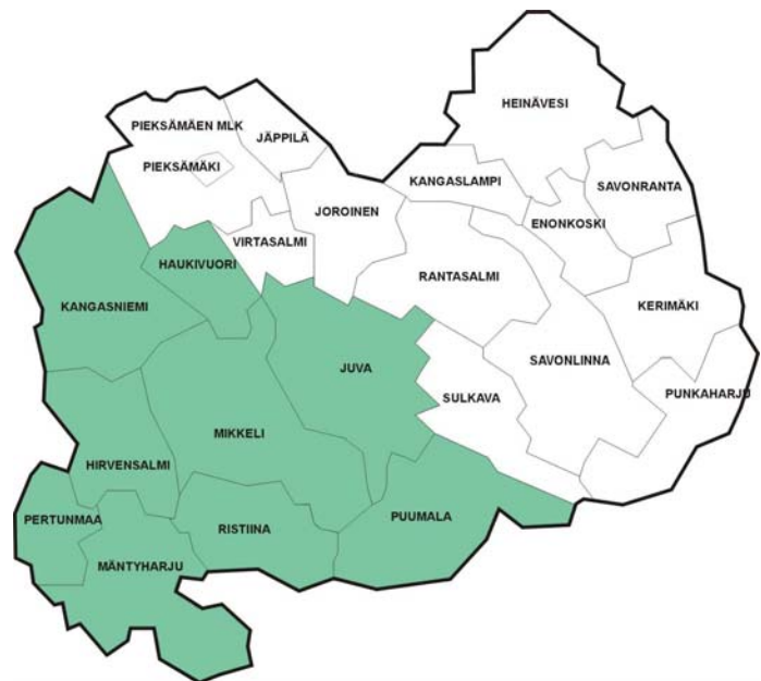
Kuva 1. Mikkelin seudun aluekeskusohjelma-alue.

ty-harju, Pertunmaa, Puumala ja Ristiina. Alueella asuu noin 84 000 henkeä, mikä on puolet koko maakunnan väestöstä. Alue on sisäasiainministeriön seutukuntajaotuksen mukaista seutukuntaa laajempi.